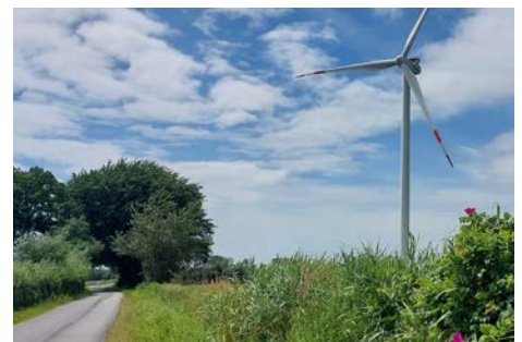
Hab und Gut für fast 6 Wochen / Bahn-Querung des NOK / Startpunkt im Norden / Wandern auf ruhigen Sträßchen