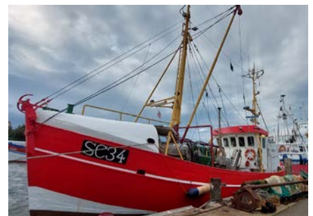
die Regionalbahn von Husum nach St.-Peter-Ording / am Eidersperrwerk / am Museumshafen in Büsum