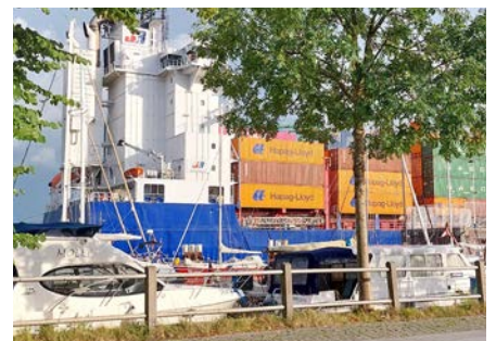
auf dem Küstenradweg am Wattenmeer / multifunktionales Bushäuschen / an der Schleuse in Brunsbüttel