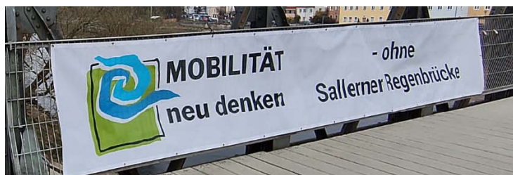
Pressemitteilung zum Stand des Bürgerbegehrens

Fuß- und Rad- wegeverbindung von der Uni in die Innenstadt (ÖPNV-Tour am 17.04.2026)