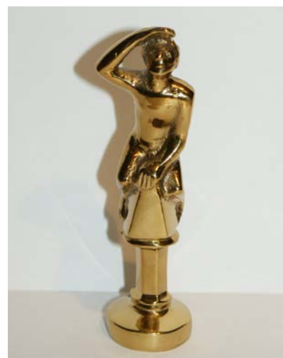
VCD-Bruckmandl 2025 / Verleihung am 21.03.26

Regensburg mobil am 16.05.2026 von 11:00 Uhr – 18:00 Uhr auf dem Neu- pfarrplatz / Mithilfe bei Auf-/Abbau und Betreuung des Info-Standes ist sehr erwünscht!