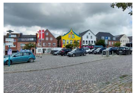
übersichtliche Fahrpläne in Nordfriesland / Brotzeit in Dagebüll an der Nordsee / Tristesse am Marktplatz in Bredstedt